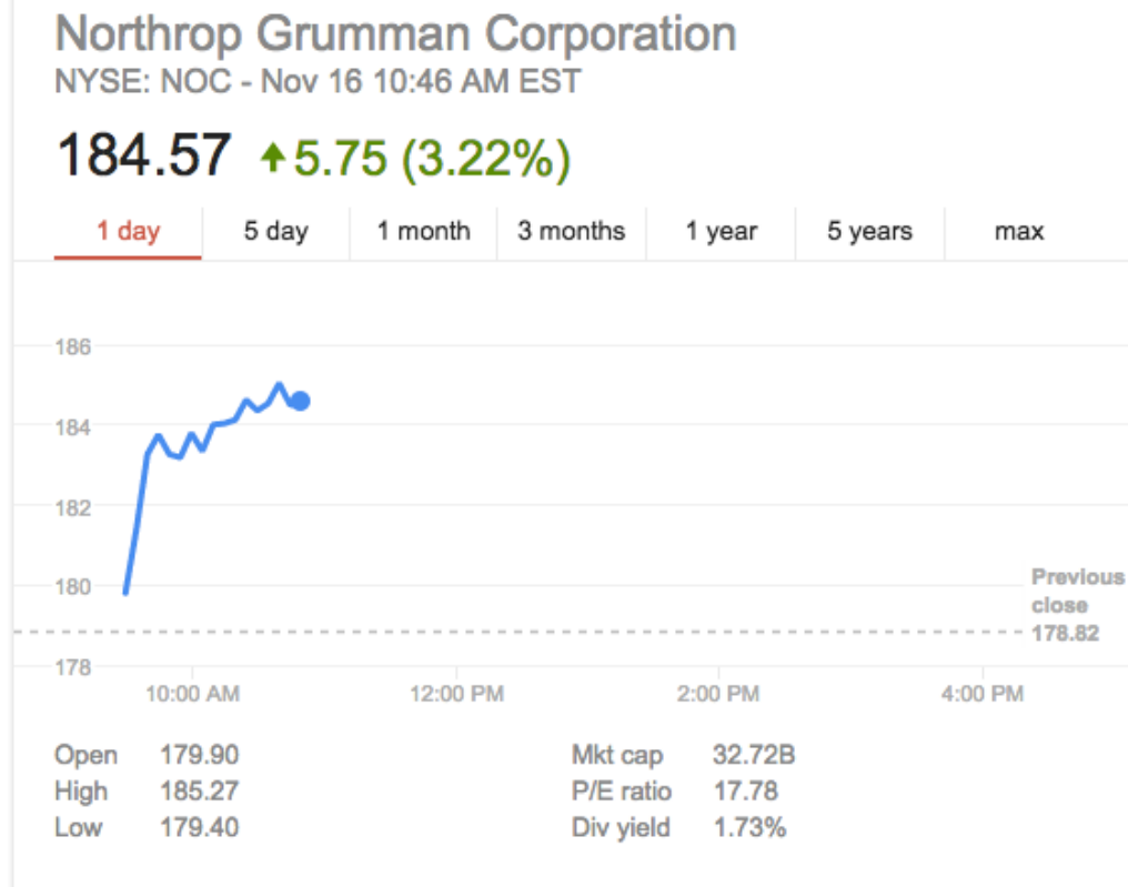
Northrop Grumman Corporation